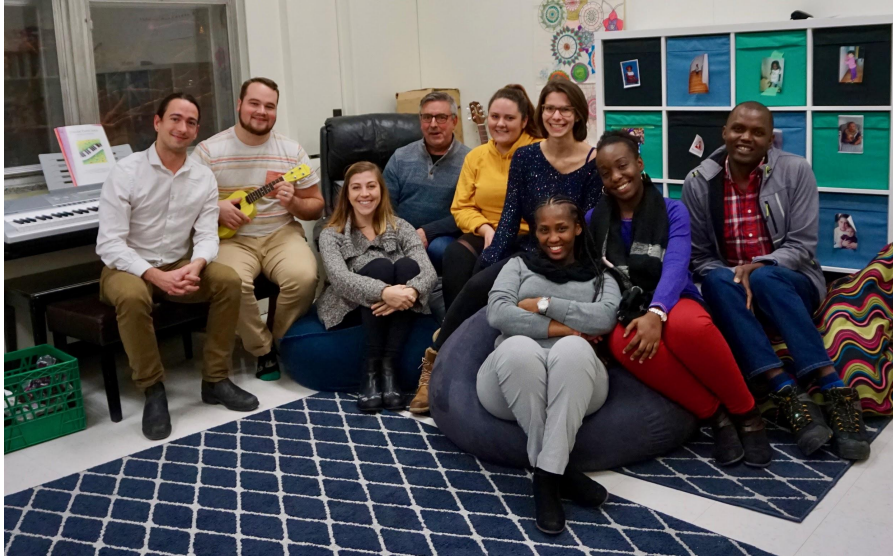
Photo de classe cours en Théorie et Fondement d'Innovation Sociale.

L'université Saint-Paul est une petite université qui propose une pédagogie active et une évaluation continue.